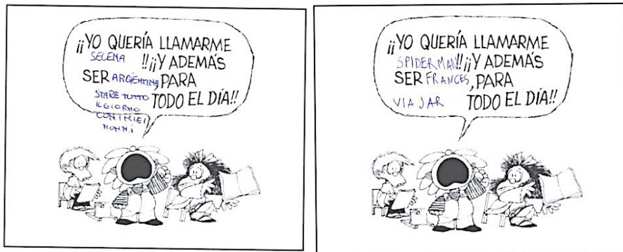
Selena, (9 años) 21